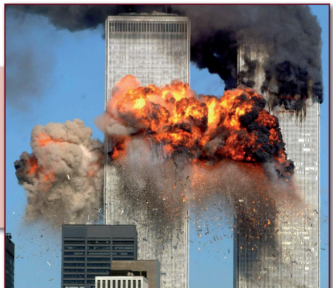
Imagem impressionante da destruição das “torres gêmeas” (World Trade Center) em 11/9/2001. Nesses dez anos, os estudos de impacto da violência sobre o psiquismo – TEPT – passaram a se preocupar com, além dos conflitos armados entre países (agora em número ínfimo), o terrorismo, a violência urbana, catástrofes naturais e os desastres.