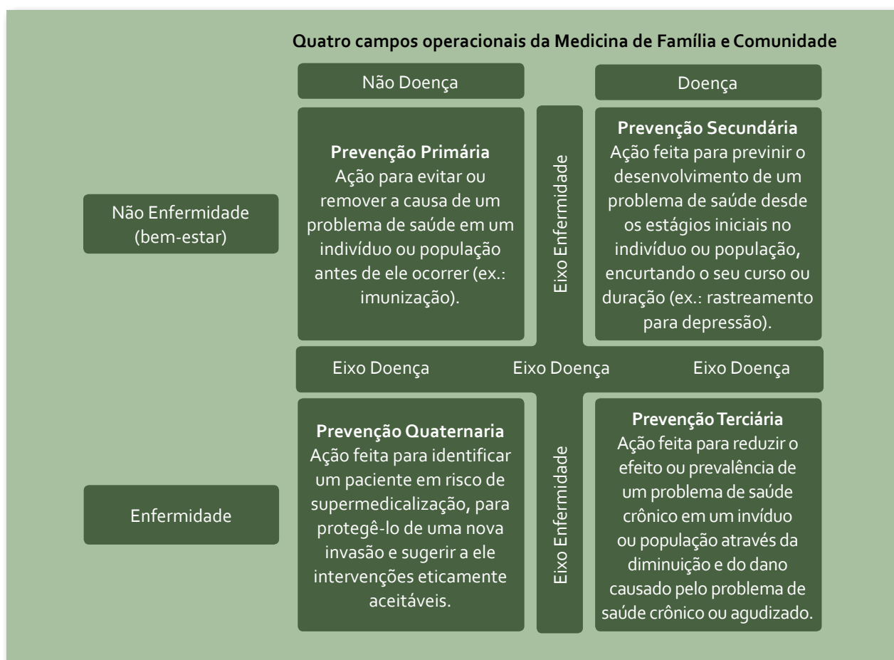
Figura 2 – Prevenção quaternária (KUEHLEIN, 2010; BENTZEN, 2003; GUSSO, 2009).

O modelo de Leavell e Clark estava equivocado porque lidava com a história natural das doenças, mas nem sempre as pessoas têm uma doença. Entretanto, para o caso em questão e para o que pretendemos discutir agora, mesmo no modelo de Leavell e Clark, podemos inferir que as atividades preventivas não se resumem a diagnóstico precoce ou promoção à saúde.