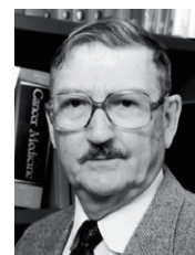
Van Rensselaer Potter

Van Potter estava preocupado com a dimensão que os avanços da ciência, principalmente no âmbito da biotecnologia, estavam adquirindo. Assim, propôs um novo ramo do conhecimento que ajudasse as pessoas a pensar nas possíveis implicações (positivas ou negativas) dos avanços da ciência sobre a vida (humana ou, de maneira mais ampla, de todos os seres vivos). Ele sugeriu que se estabelecesse uma “ponte” entre duas culturas, a científica e a humanística, guiado pela seguinte frase: “Nem tudo que é cientificamente possível é eticamente aceitável”.