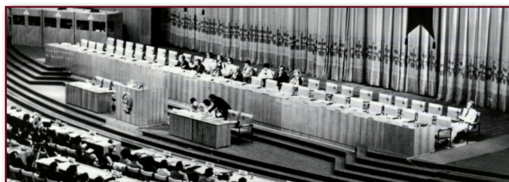
_Fig. 1 - Conferência de Alma-Ata, na antiga União Soviética, Organização Mundial da Saúde, 1978.

Assim, durante a Conferência que culminou com a Declaração de Alma-Ata, organizada pela OMS em 1978, na antiga União Soviética, a saúde foi reconhecida como direito fundamental das pessoas e comunidades, sendo enfatizado o acesso universal aos serviços de saúde e a intersetorialidade das ações, e ficando evidenciada a APS como estratégia básica para a consecução desses objetivos (MELLO, 2009). O lema Saúde para Todos no ano 2000 foi o mote das discussões, o qual seria alcançado pelo desenvolvimento da APS e seus princípios em todos os países do mundo. A Figura 1 a seguir traz uma imagem panorâmica da Conferência de Alma-Ata, em 1978.